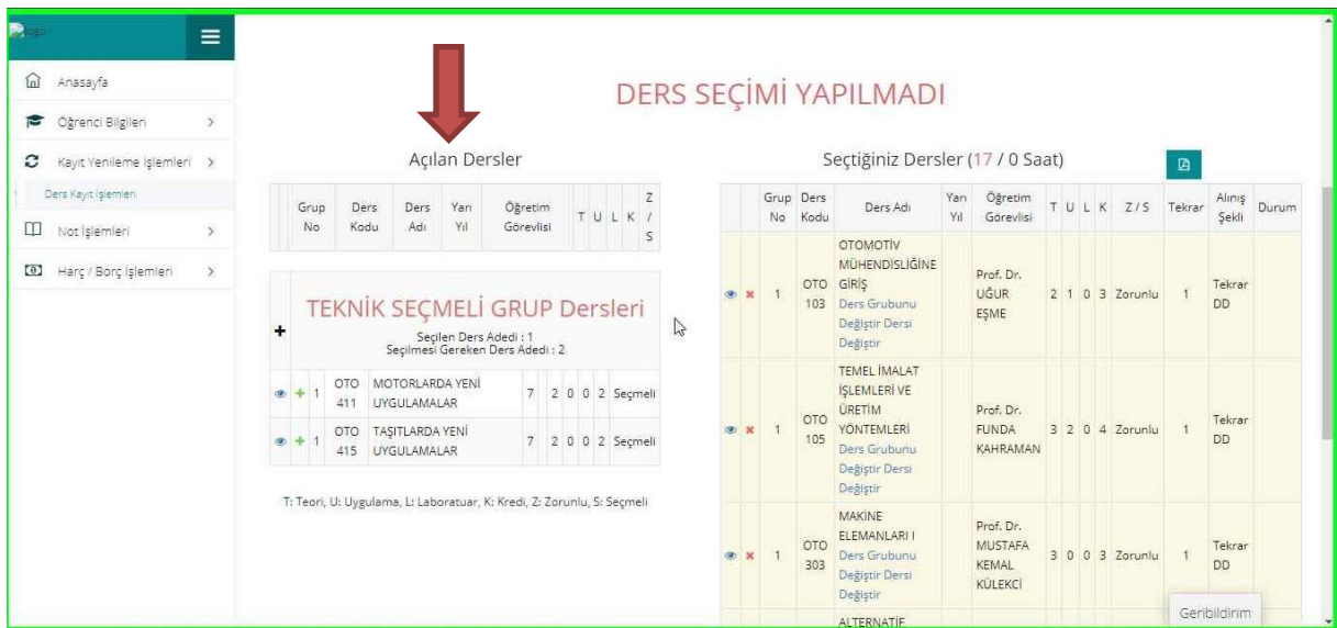
Resim-3 Derslerin Seçilmesi Ekranı

3. Açılan Kayıt Yenileme (Ders Seçme) İşlemleri ekranında “Açılan Dersler” bölümünden seçebileceğiniz dersleri görebilir ve aynı ekrandan kayıt yaptırmak istediğiniz dersleri seçerek “Seçilen Dersleri Ekle” butonu vasıtasıyla ders seçim işlemi tamamlayabilirsiniz. Alt yarıyıldarda alınan ve başarısız olunan tekrar dersleri sistem tarafından zorunlu olarak seçilmekte olup bu dersler ders kaydından çıkarılamaz.