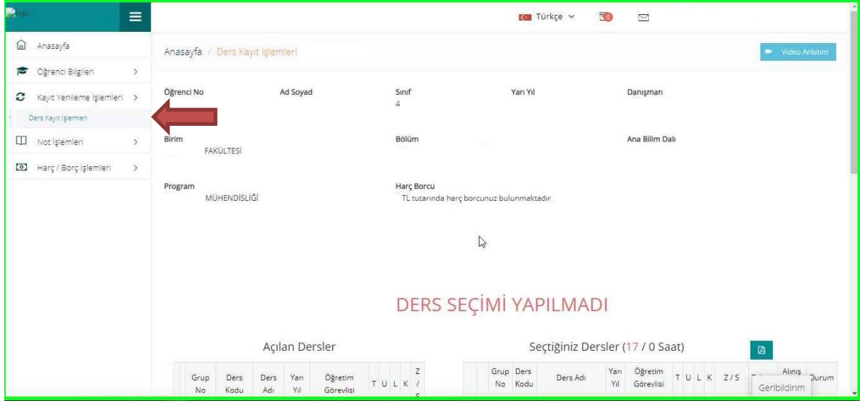
Resim 2- Kayıt Yenileme (Ders Seçme) İşlemleri Sayfası

2. Sisteme giriş yaptıktan sonra aşağıda “Resim-2” de gösterilen sayfa karşınıza gelecektir. Ekranın sol tarafında yer alan menüde bulunan “Kayıt Yenileme (Ders Seçme) İşlemleri” bağlantısını tıklayarak ders seçimi yapılacak olan sayfaya erişim sağlayınız.